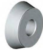
J cone Ø 40 for cross-country and 4WD wheels range Ø 101-119 mm