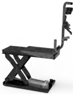
WBL80 Professional automatic wheel lift capacity 80 kg