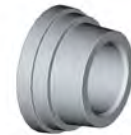
Special cone Ø 40 for central hole Ø 89/132 mm