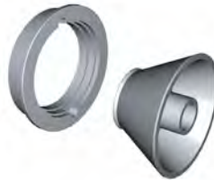
VL/2 cone Ø 40 Large cone for light truck 97-180 mm