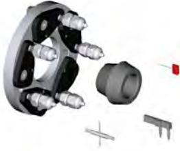
UH20/2 Ø 40 Universal adapter 3-4-5-6 hole