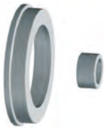
WD spacer Ø 40 (Spacer for wide wheels) + DC spacer Ø 40 (to use together with WD)