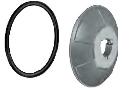
RL cup Ø 40 with rubber ring for alloy rims protection